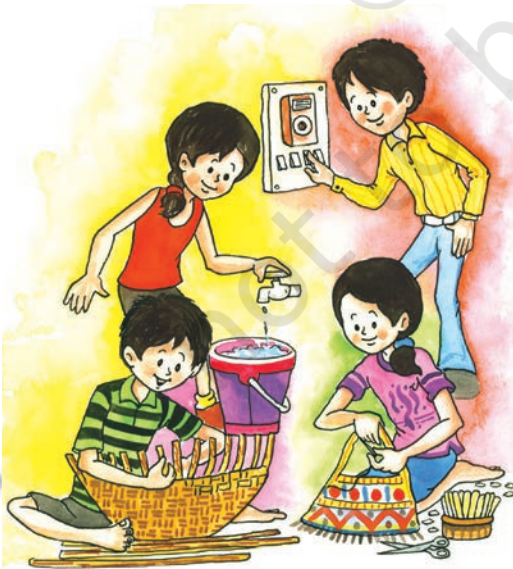
4 संसाधन एवं विकास

सततपोषणीय विकास संसाधनों का सावधानीपूर्वक उपयोग ताकि न केवल वर्तमान पीढ़ी की अपितु भावी पीढ़ियों की आवश्यकताएँ भी पूरी होती रहें।